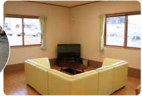
リビングスペース